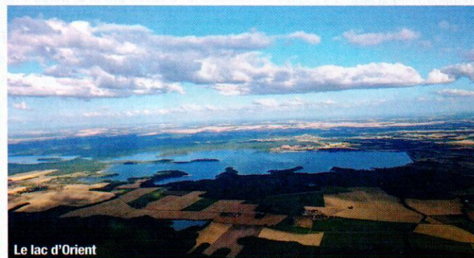
Le lac d'Orient

Le 6 septembre, Franck Arnaud bat avec 239 km le record du site de treuil d'Orbigny: il passe Chatellerault, Poitiers, Niort, son arrivée au soleil couchant sur la plage de Marennes d'Oléron est un moment d'anthologie... C'était son 100 e vol de plus de 100 km.