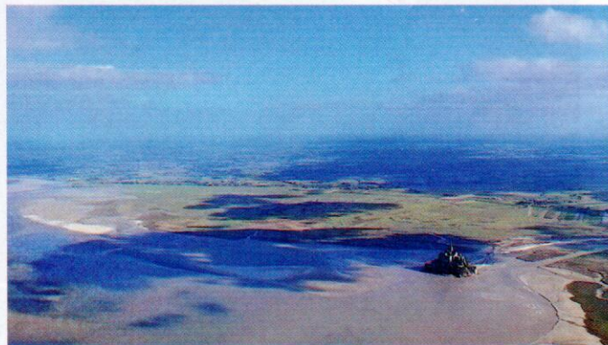
Le tour du mont Saint-Michel, un moment inoubliable pour Édouard Bara

Contact: bouquetxavier@hotmail.fr , +33 (0)688154242.