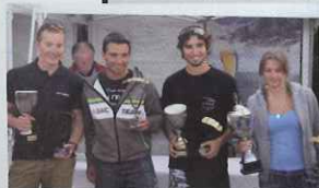
Amicale à Quittebeuf, 24 nouveaux pilotes ont pu goûter à la compétition.

Remerciements aux sponsors: conseil régional de Basse Normandie, conseil général de la Manche et du Calvados, Flyeo, les Passagers du Vent.